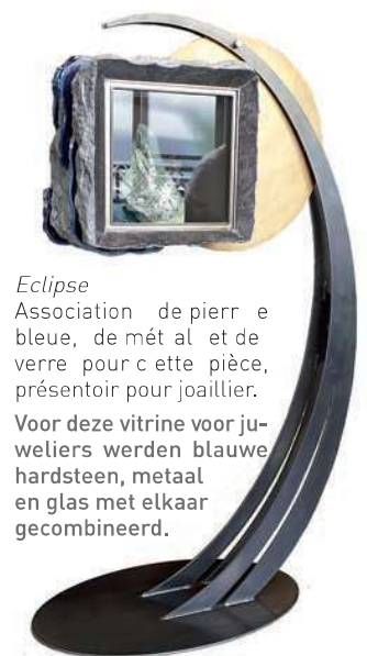
Eclipse Association de pierre bleue, de métal et de verre pour cette pièce, présentoir pour joaillier. Voor deze vitrine voor juweliers werden blauwe hardsteen, metaal en glas met elkaar gecombineerd.